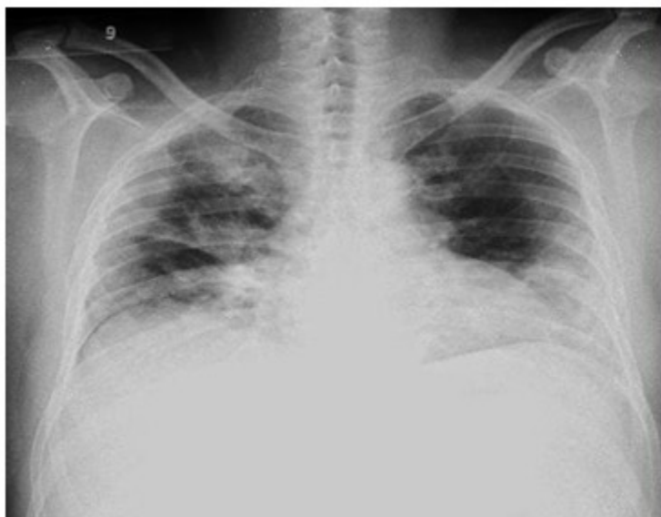
Fig. 2. Imagen que muestra radiopacidades difusas, con mayor cuantía en regiones hilar y parahiliares.

Se recibieron los resultados de esputo BAAR con codificación 0, esputo bacteriológico negativo; así como hemocultivos I, II, III; exudado nasofaríngeo con flora normal; serología y VIH no reactivos, antígeno y anticuerpo virus hepatitis B y C, respectivamente también negativos.