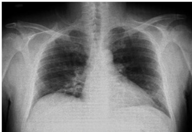
Fig. 1. Imagen que muestra la radiopacidad poco homogénea y aspecto inflamatorio hilio basal derecha.

Se decidió realizar tomografía axial computarizada de cráneo y punción lumbar, las cuales resultaron negativas.