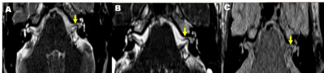
Fig. 1. Imagen de resonancia magnética nuclear, en secuencia de T2 ciss3D axial (A y B). C, T2 TSE AXIAL. Se observa bucle vascular (flecha amarilla) producido por un trayecto redundante de la arteria cerebelosa anteroinferior (AICA) en el interior del conducto auditivo interno del lado izquierdo.

Se realizó una resonancia magnética nuclear (RMN) de oído interno mediante la que se observó un asa vascular en el ángulo pontocerebeloso izquierdo que ingresaba al conducto auditivo interno (CAI) en menos de 50 % de su longitud. Clasificación anatómica Chavda tipo II, formando un bucle entre el complejo del VII-VIII par craneal. (Fig. 1 y Fig. 2).