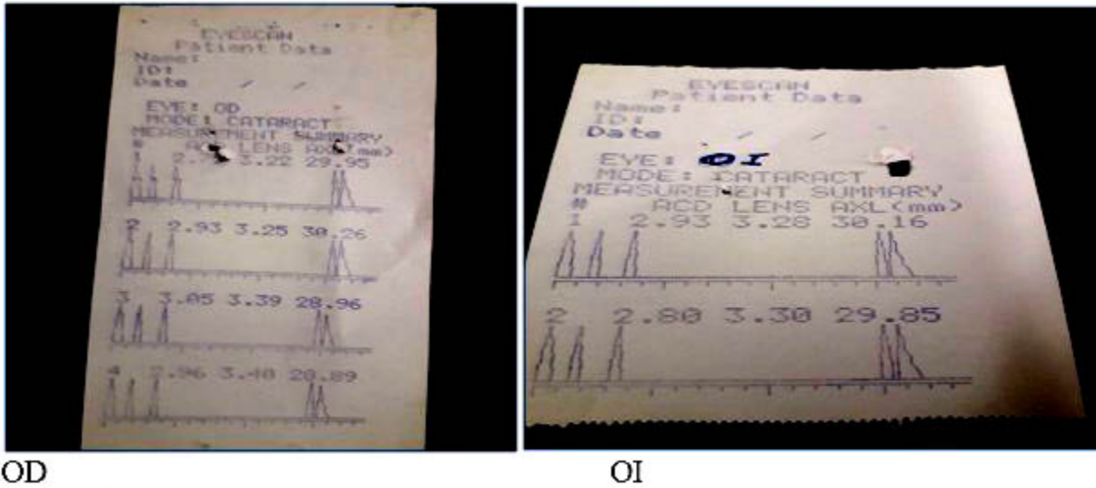
OD Fig. 5. Estudio biométrico.

Alteraciones no oculares: dismorfismo craneofacial leve, hipertelorismo, hipoplasia maxilar con aplanamiento del tercio medio facial,