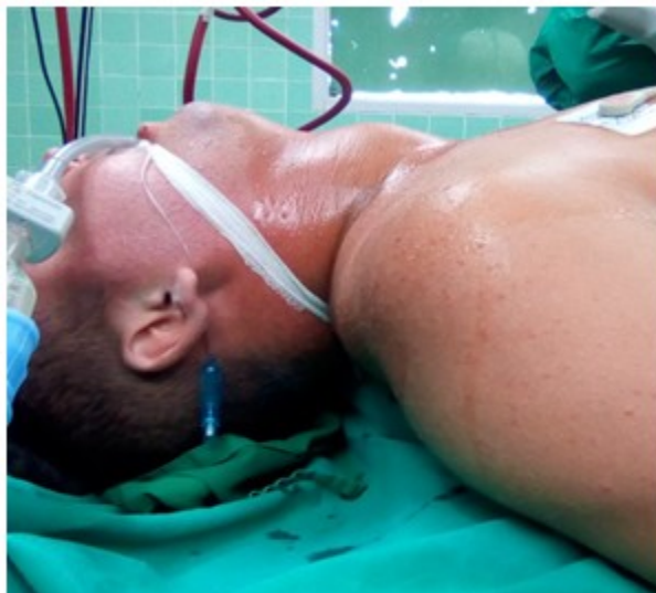
Fig. 1- Paciente en decúbito supino. Se observa aumento de volumen de la parte anterior del cuello, sobre todo del lóbulo derecho.

Se indicaron exámenes complementarios y estudio por imágenes. Se realizó hemograma con diferencial y leucograma, además de estudios renales, ya que el enfermo unos meses antes comenzó a presentar cifras altas de creatinina y hematuria. Como datos positivos, se obtuvo hemoglobina de 9 g/dl y una leucocitosis de 14 \times 10^9 , que dada la ausencia de fiebre, rubor y calor local, se interpretó como una consecuencia del