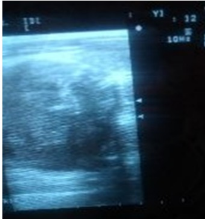
Fig. 4- Ultrasonido de cuello: Lóbulo derecho aumentado de volumen con el aspecto de un hematoma intraglandular.

Tres días después, los signos de compresión a nivel del cuello se fueron agudizando, y fue necesario realizar un ultrasonido evolutivo, pues el riesgo de asfixia estaba latente, debido a la coagulopatía, y la posibilidad de que el cuadro de “sangramiento” continuara en aumento, y provocara mayor compresión en tráquea y