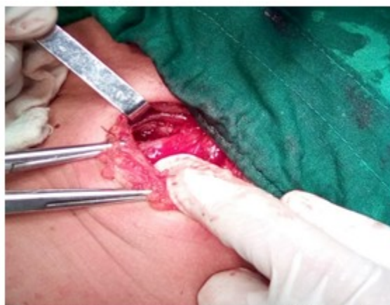
Fig.7- Biopsia de segmento del lóbulo izquierdo.

En el lóbulo izquierdo se realizó el mismo procedimiento. Pudo comprobarse que este presentaba una capsula gruesa, de unos 0,4 mm y el interior de la glándula comenzaba a tomar el aspecto de un tejido macerado, del cual se realizó biopsia mediante incisión en cuña de la glándula y, hemostasia en sitio cruento. (Fig. 7).