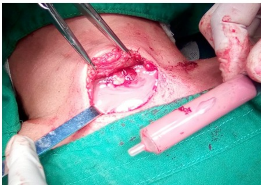
Fig. 6- Absceso de la glándula tiroides.

Se realizó aspiración del pus con la aspiradora de pared y lavado de la cavidad con iodopovidona y suero fisiológico. Se observó que la cavidad del absceso estaba dirigiendo sus trayectos hacia la región submaxilar derecha, cartílago cricoides y por la parte inferior del istmo, comenzando a comunicar con el lóbulo contralateral, parte de la glándula, y se prolongaba hacia el mediastino,