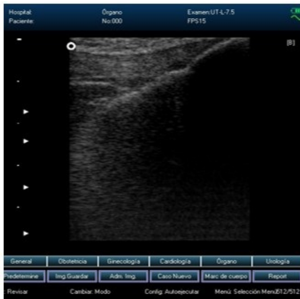
Fig. 2 a). Patrón ecográfico normal, subcuadriceps, rodilla izquierda, bailarina CINUT.