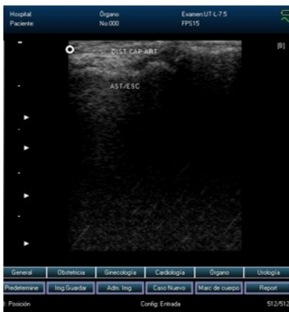
Fig. 3 b). Distensión de la cápsula articular articulación astrágalo-escafoides.

Con el análisis de correlación no paramétrica de Spearman, se correlacionó la edad cronológica y las modificaciones del patrón ecográfico de normalidad a nivel de rodilla, tobillo y pie. En rodilla hubo valores p significativos, de 0,014; existiendo correlación entre variables. Por su