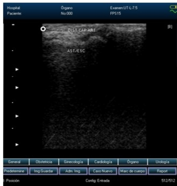
Fig. 3 b). Distensión de la cápsula articular articulación astrágalo-escafoides.

Con el análisis de correlación no paramétrica de Spearman, se correlacionó la edad cronológica y las modificaciones del patrón ecográfico de normalidad a nivel de rodilla, tobillo y pie. En rodilla hubo valores p significativos, de 0,014; existiendo correlación entre variables. Por su