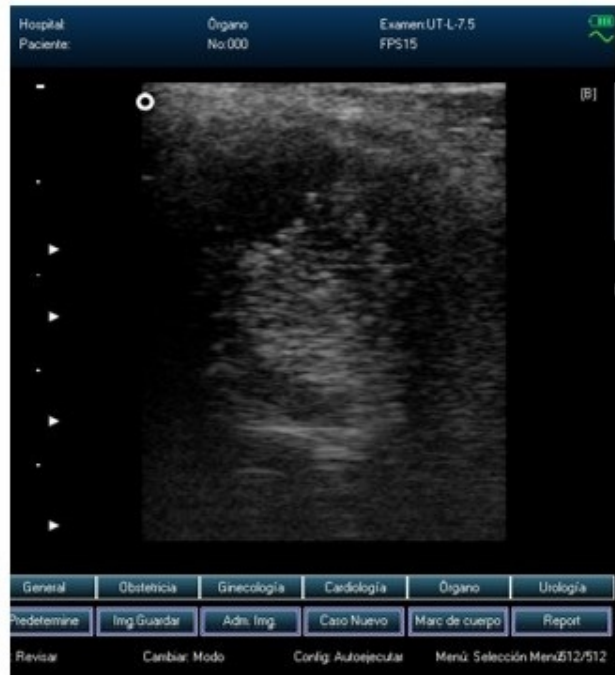
Fig. 1b). Cambio en el patrón ecográfico a nivel de menisco lateral, rodilla izquierda, bailarina CINUT.