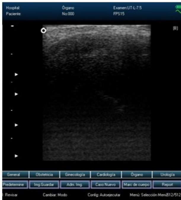
Fig. 1a). Patrón ecográfico normal a nivel de menisco lateral, rodilla izquierda, bailarina CINUT.