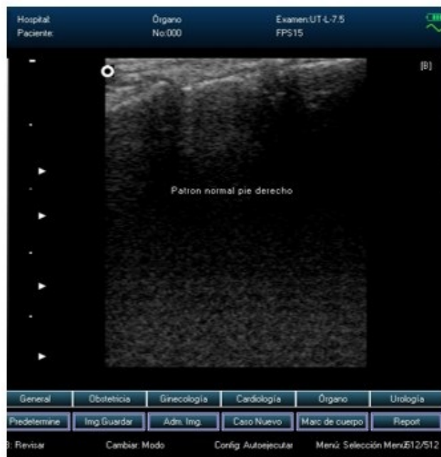
Fig. 3 a). Patrón ecográfico normal de la cápsula articular articulación astrágalo-escafoides.