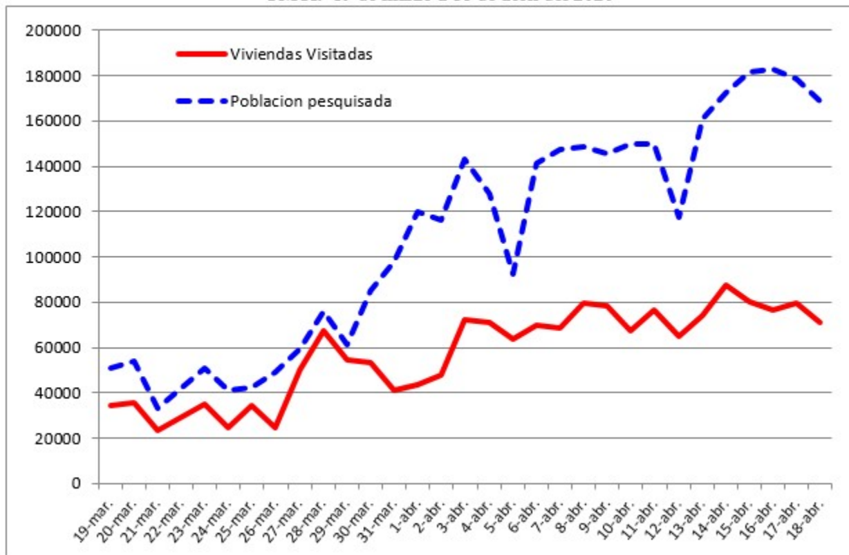
Gráfico 2. Número de viviendas visitadas y población pesquisada diariamente por estudiantes de la UMCf. 19 de marzo a 18 de abril del 2020