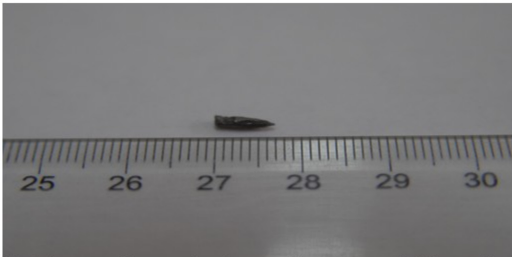
Fig. 2. Cuerpo extraño oscuro, alargado, compatible con una punta de lápiz, extraído en el acto quirúrgico.

En el acto quirúrgico se decoló la conjuntiva extrayéndose íntegramente un cuerpo extraño oscuro, alargado (de aproximadamente 7 mm de longitud), con uno de los extremos puntiagudo y el otro romo, compatible con una punta de lápiz. La esclera a ese nivel estaba íntegra. (Fig. 2).