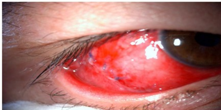
Fig. 5. Sutura con seda 8-0, después de extraído el cuerpo extraño y tejido adyacente.

Se suturó conjuntiva y epiesclera con seda 8-0. (Fig. 5).