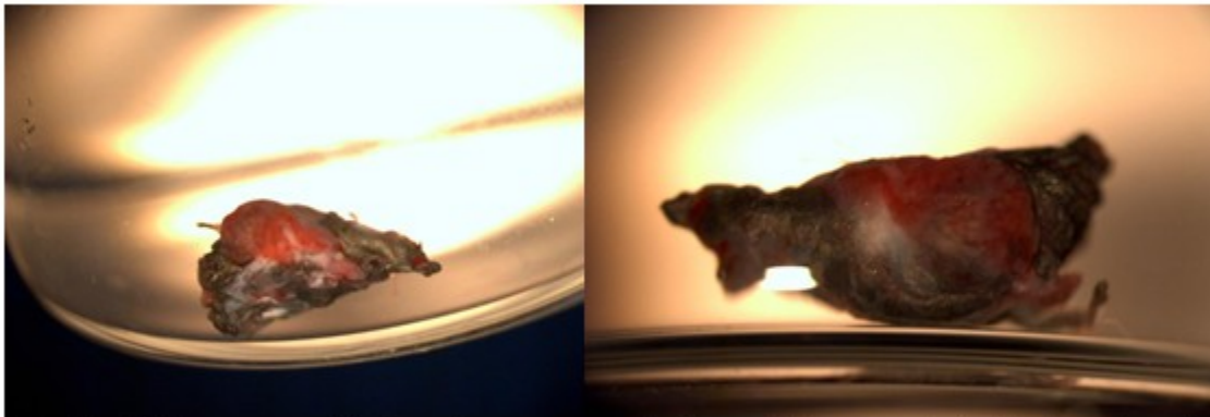
Fig. 3 y 4: Masa engrosada, de color oscuro, con brillo metálico, vascularizada, irregular y de aspecto fibrovascular que se encontraba adyacente al cuerpo extraño.

aspecto fibrovascular, la cual se extrajo para la realización del estudio histopatológico. (Fig. 3 y 4).