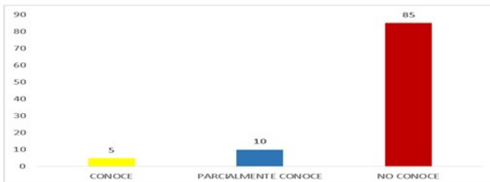
Figura 4. Nivel de conocimiento de los estudiantes sobre la herramienta blended learning .

En cuanto a la disposición para conocer y utilizar la herramienta, casi el total de estudiantes (99 %) respondió afirmativamente.