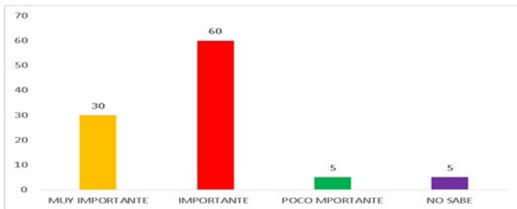
Figura 2. Nivel de importancia del uso de las TICs en la promoción de la salud

Sobre el manejo de herramientas informáticas, un 80 % refirió un manejo regular de estas; y