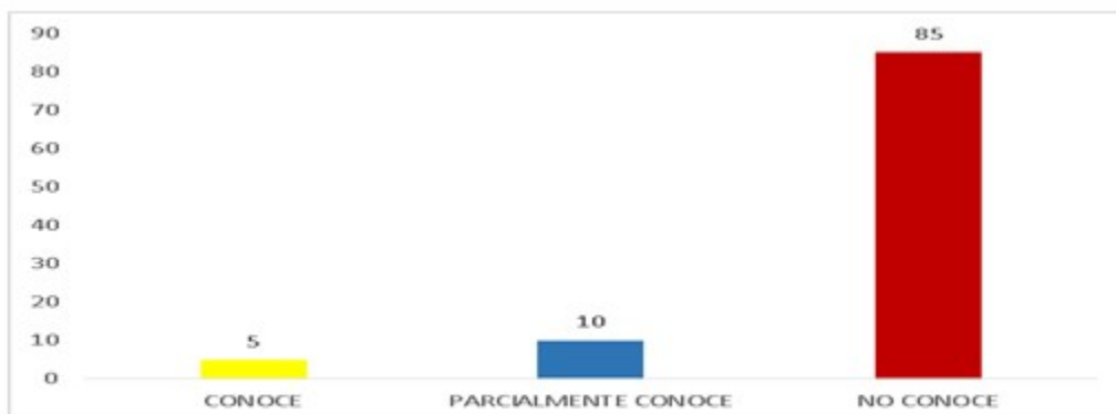
Figura 4. Nivel de conocimiento de los estudiantes sobre la herramienta blended learning .

En cuanto a la disposición para conocer y utilizar la herramienta, casi el total de estudiantes (99 %) respondió afirmativamente.