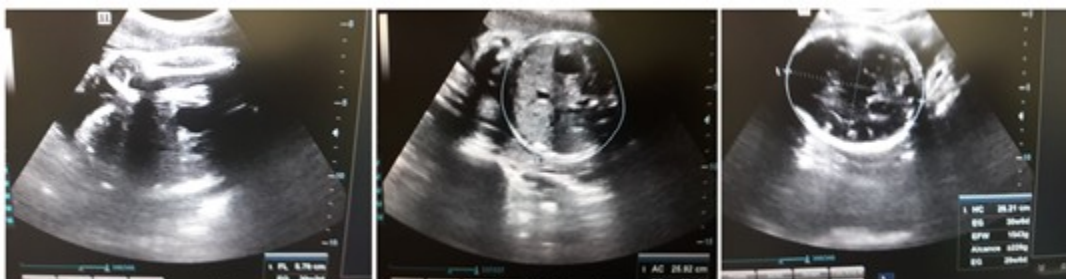
Figura 3. Imágenes de la ecografía realizada al término del primer trimestre de la gestación.

momento a los servicios obstétricos, constituyó un resultado importante. Se consideró como de alto riesgo obstétrico, y se realizaron orientaciones específicas para el seguimiento en la atención prenatal, al existir altas probabilidades de morbimortalidad perinatal. La evolución clínica ha sido favorable hasta el tercer trimestre, sin patologías propias o asociadas al embarazo, y con curvas de peso, tensión arterial y de altura uterina acordes al período de gravidez. Se realizó ecografía obstétrica correspondiente al período gestacional, que confirmó el completo bienestar materno fetal. (Figura 3).