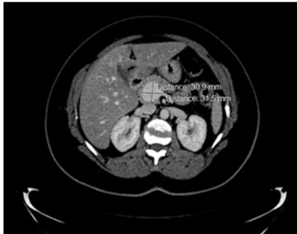
Fig. 1 Se observa la dilatación de la vena porta en una fase venosa en un corte axial de la tomografía axial computarizada.