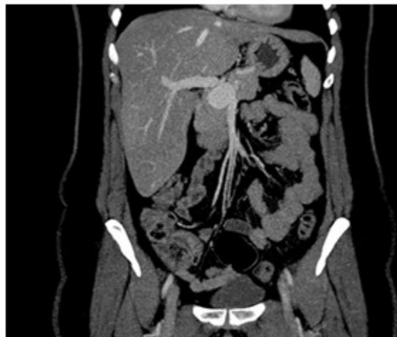
Fig. 2 Se observa imagen sacular en proyección de la vena porta