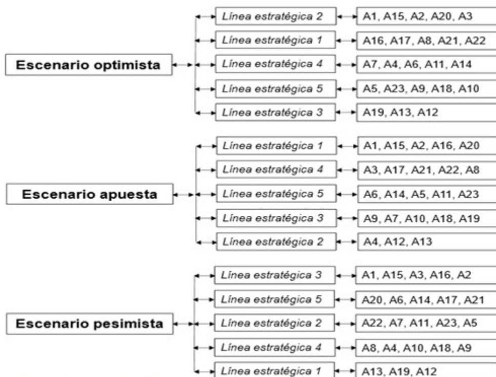
Fig. 2. Marco de escenarios, líneas estratégicas y acciones Fuente: elaboración de los autores a partir de los resultados de la matriz de acciones en función de líneas estratégicas ordenadas por desempeño y el plano de perfiles de líneas estratégicas y escenarios