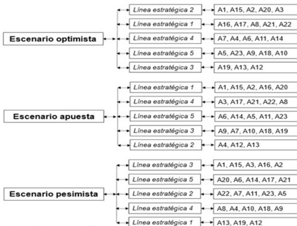
Fig. 2. Marco de escenarios, líneas estratégicas y acciones Fuente: elaboración de los autores a partir de los resultados de la matriz de acciones en función de líneas estratégicas ordenadas por desempeño y el plano de perfiles de líneas estratégicas y escenarios