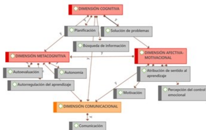
Fig. 1. Modelo de red de las dimensiones y subdimensiones de las habilidades de AaA.

Los resultados de las subdimensiones de las habilidades de AaA muestran los mejores valores para la motivación hacia el estudio (68,2 %) y la comunicación asertiva (65,5 %) mientras que las