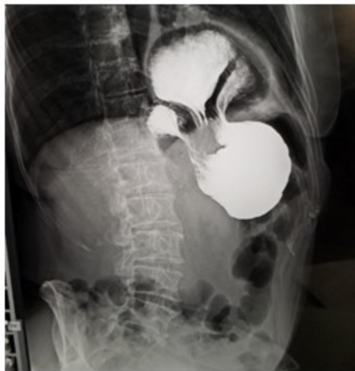
Fig. 2- Estudio esófago-estómago-duodeno contrastado con bario.

la primera porción del duodeno por encima del pilar diafragmático, con pobre paso de contraste hacia asas delgadas (Fig. 2). Por los estudios imagenológicos se definió como una hernia hiatal gigante (grado III clasificación de Akerlund, grado IV clasificación de Allison).