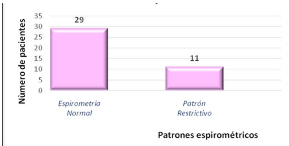
Fig. 2- Distribución de pacientes según patrones espirométricos.

correspondió a espirometrías normales. No se identificaron patrones espirométricos de tipo obstructivo o mixto. (Fig. 2).