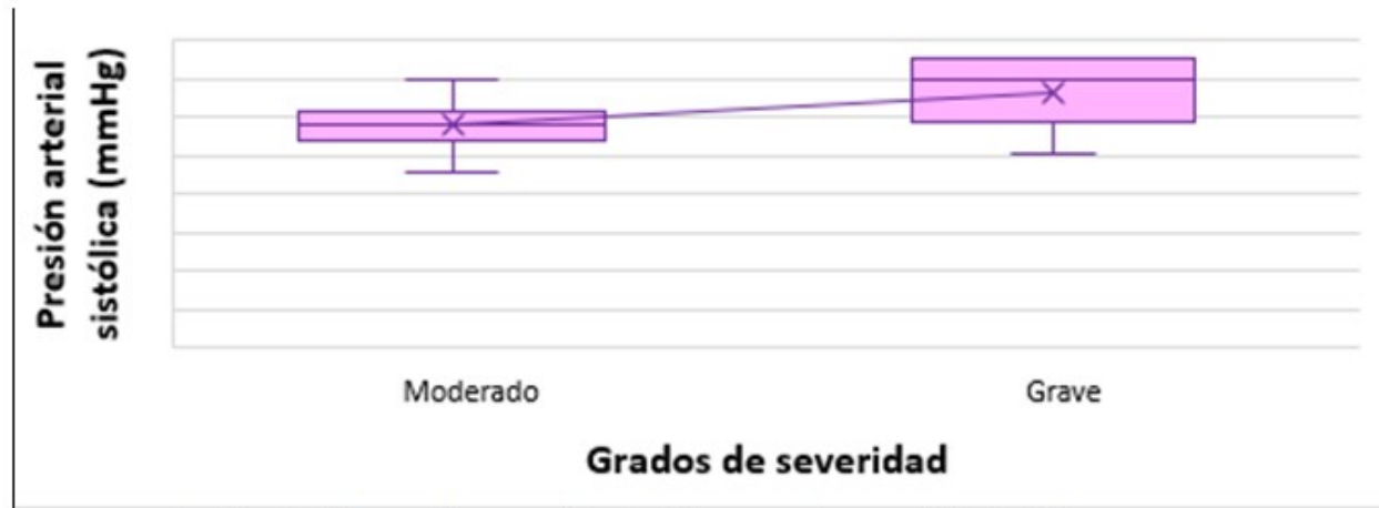
Fig. 3- Relación de la presión arterial sistólica con la severidad del COVID-19.

entre la frecuencia cardíaca (FC) y el número de espirometrías normales (p= 0,006), mientras que el signo vital directamente relacionado con la severidad del COVID-19 fue la presión arterial sistólica (PAS), específicamente con los casos moderados (p=0,009) y graves (p= 0,004), según resultó al comparar las medias de ambas variables. (Fig. 3).