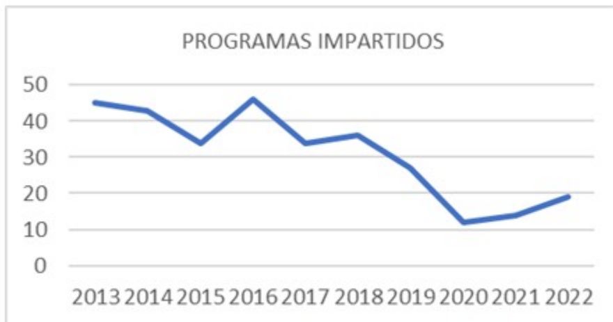
Fig.1. Programas impartidos según año fiscal

que ascendió a 310, y con ello se elaboró un gráfico de tendencia. Durante los años 2013 al 2018 hubo estabilidad en el número de programas de superación profesional desarrollados, con ligeras fluctuaciones; y una regresión en la cantidad, con el pico más bajo en el año 2020, a partir del cual la tendencia es ascendente. La forma organizativa más utilizada es el curso con 179 programas, seguido de taller 102, y el resto se divide entre diplomado, evento y entrenamiento, en ese orden. (Fig.1).