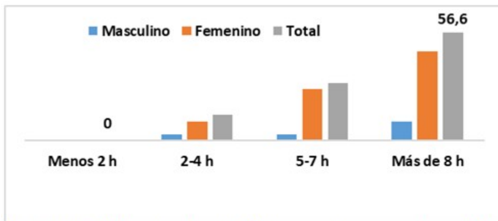
Fig. 3- Distribución de estudiantes según sexo y horas/día utilizadas para conexión a internet.

Solamente 8 estudiantes refirieron que utilizan la internet para actividades académicas, cifra que