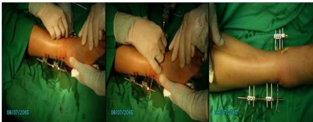
Fig. 3,4 y 5. Imágenes del procedimiento quirúrgico.

Se muestran imágenes del procedimiento quirúrgico y rayos X del posoperatorio. (Fig. 3 a 6).