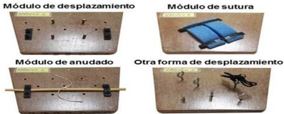
Figura 3. Imágenes que muestran los distintos módulos

Consta de cuatro módulos para el entrenamiento. (Figura 3).