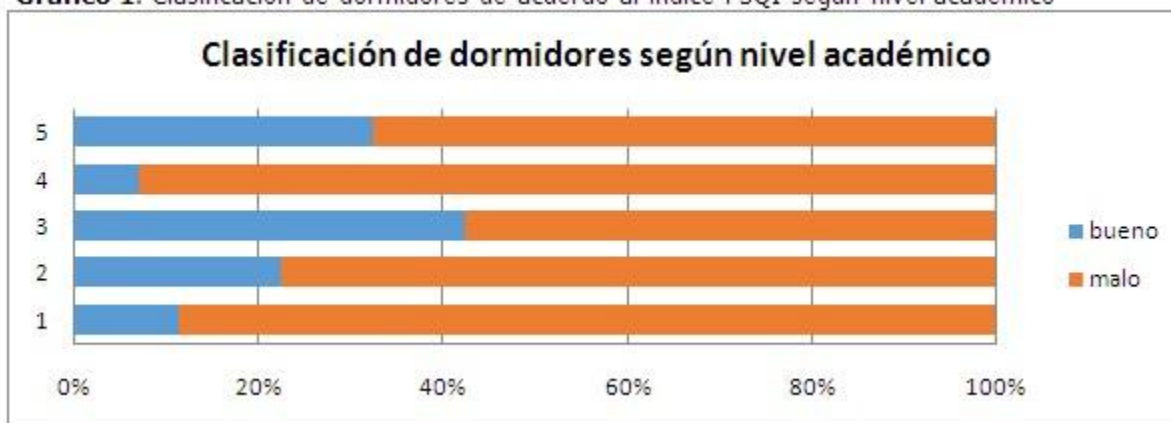
Gráfico 1. Clasificación de dormidores de acuerdo al índice PSQI según nivel académico

Al considerar el punto de corte mayor o igual a 5 para la definición de mal dormir se observó que los estudiantes del curso 4° son los clasificados como los peores dormidores. En el 1° año son 55/62 (88,7%); en el 2° año son 52/67 (77,6%); en el 3° año son 46/80 (57,5%); en el 4° son 53/57 (93%) y en el 5° año son 44/65 (67,7%). (Gráfico 1).