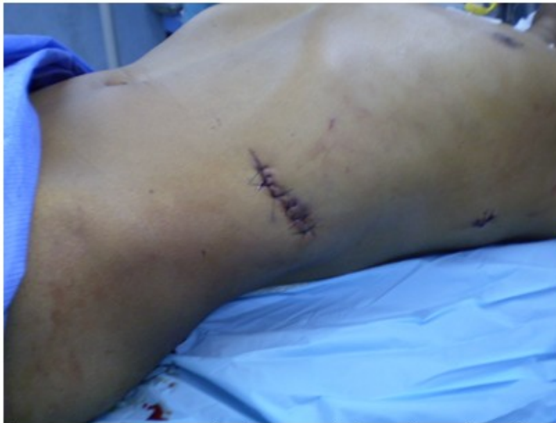
Figura 1. Paciente con herida toracoabdominal a nivel de línea axilar posterior en hemitórax izquierdo y herida subcostal izquierda.

Radiografía de tórax anteroposterior (AP): No se observaron alteraciones pleuro pulmonares.