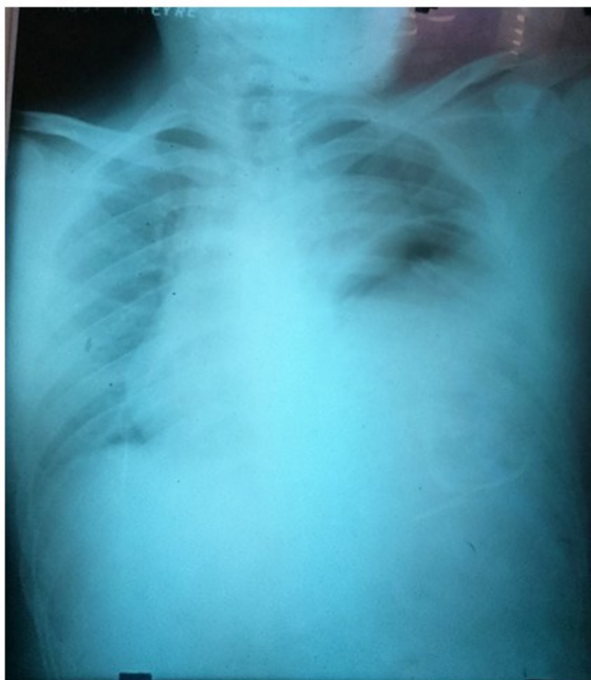
Figura 3. Radiografía simple de tórax en posición anteroposterior. Se observa presencia de fondo gástrico en hemitórax izquierdo, elevación del hemidiafragma y desplazamiento de la silueta cardiaca.

Lavado peritoneal: Se identificó contenido hemático en la cavidad abdominal.