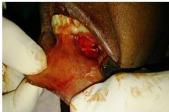
Figura 3. Desección del nervio mentoniano.

Luego se localiza y disecciona este nervio. (Figura 3).