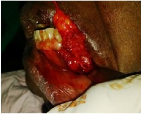
Figura 2. Compromiso con el nervio mentoniano.

Luego se localiza y disecciona este nervio. (Figura 3).