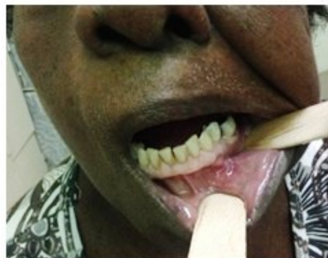
Figura 6. Aspecto postoperatorio a los 21 días de la operación.

Se remite la muestra a estudio histopatológico biopsia no. 18B-2494 que informa: fragmento de tejido irregular de 2x1,5 cm, superficie bilobular, blanco -pardo, grisáceo y área amarilla de cuerpo adiposo, al corte amarillento que histológicamente está formado por células adiposas adultas con su citoplasma lleno de grasa y el núcleo situado en la periferia. Se realizan controles post quirúrgicos a las 48 h, a los 7 y 21 días sin evidencia de recidiva, con evolución clínica satisfactoria (Figura 6) presentando aparición de parestesia en hemilabio inferior izquierdo.