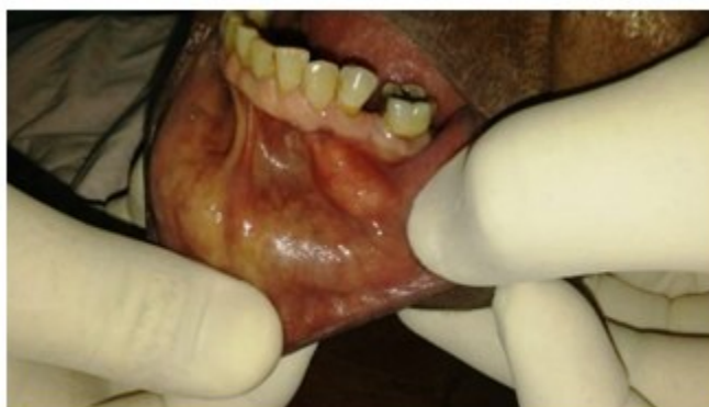
Figura 1. Aspecto preoperatorio de la lesión

Al examen intraoral: se evidencia aumento de volumen de aproximadamente 2 cm de diámetro, en el surco vestibular inferior izquierdo a nivel de 33 y 34, de consistencia duroelástica y móvil, no dolorosa a la palpación, coloración amarillenta, cubierto de mucosa normocoloreada. (Figura 1).