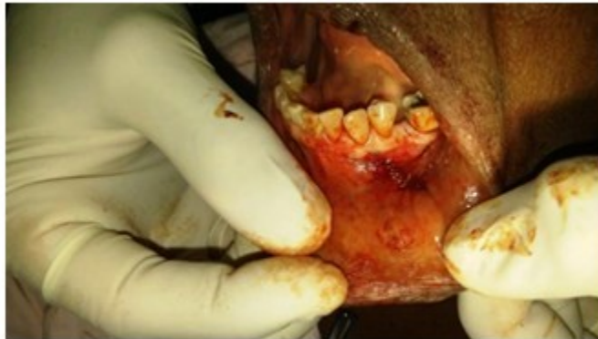
Figura 5. Hemostasia y sutura.

cavidad quirúrgica con sutura catgut cromado 4-0. (Figura 5).