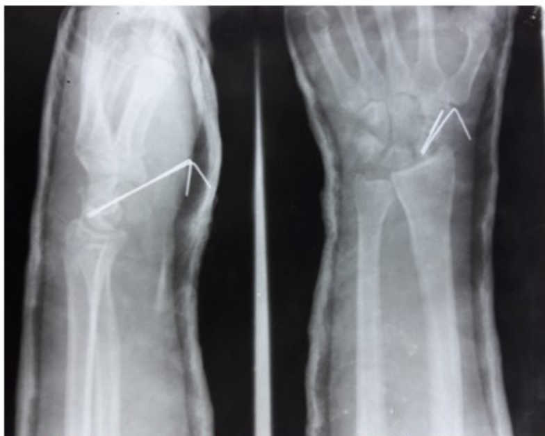
Figura 3. Imágenes radiográficas que muestran la fijación realizada.

En el momento anteriormente descrito fue explorada la estabilidad de la muñeca y se decidió no fijar otras articulaciones como la lunopiramidal o la escafolunar, paralelamente se realizó la liberación del nervio mediano, tras culminar se colocó un yeso digitoantebraquial en