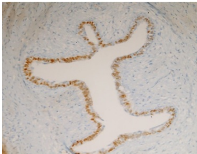
Figura 3: Del panel Inmunohistoquímico. Receptor Estrógeno positivo.