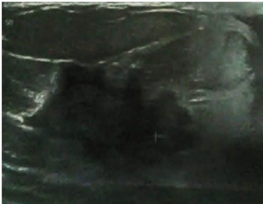
Figura 1. Imagen sonográfica que muestra lesión hipocogénica, heterogénea, de bordes irregulares.

Mamografía bilateral: mamas moderadamente grasas, heterogéneas, llamando la atención aumento de la densidad de la MD con respecto a su homóloga. En el CSE de dicha mama se observa una imagen de aspecto nodular de 62 x 43 mm de contornos irregulares. En la proyección axilar derecha se observan varias adenopatías donde la mayor mide 15 mm. Según la Breast Imaging Reporting and Data System (BI-RADS) se cataloga como categoría 5: Altamente sugestivo de malignidad.