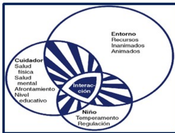
Figura 2. Modelo de evaluación de la salud infantil. Tomado de Modelos y teorías de Enfermería. Séptima Edición de Raile Alligood M, Marriner Tomey M, 2011 Elsevier España. Pág.63

Tras la elaboración de varios borradores y diferentes revisiones de los mismos, se procedió a la validación. El cuestionario que se procedió a validar estaba compuesto por trece preguntas fundamentadas en el “Modelo de interacción para valorar la salud infantil” de la doctora Kathryn E. Barnard, (11) que se representa en la Figura 2.