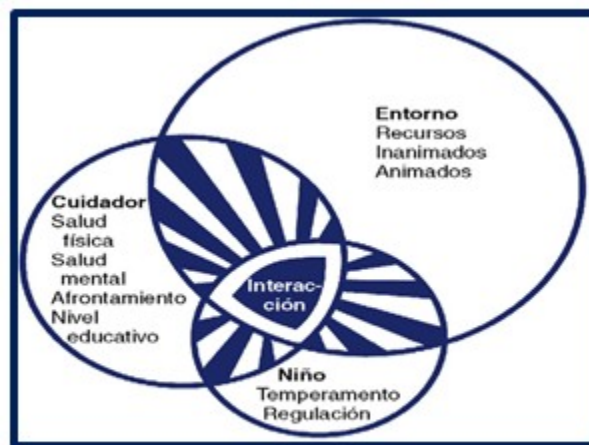
Figura 2. Modelo de evaluación de la salud infantil. Tomado de Modelos y teorías de Enfermería. Séptima Edición de Raile Alligood M, Marriner Tomey M, 2011 Elsevier España. Pág.63

Tras la elaboración de varios borradores y diferentes revisiones de los mismos, se procedió a la validación. El cuestionario que se procedió a validar estaba compuesto por trece preguntas fundamentadas en el “Modelo de interacción para valorar la salud infantil” de la doctora Kathryn E. Barnard, (11) que se representa en la Figura 2.