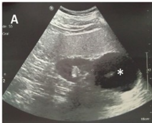
Figura 1: Imagen ultrasonográfica que muestra el tumor (señalado por el asterisco).

observando hacia su polo superior una imagen predominantemente quística de 56 X 65 mm y que pudiera estar comprometiendo la glándula suprarrenal de ese lado. Litiasis en el grupo calicial medio. Vejiga normal. Se sugiere tomografía axial computarizada de abdomen (TAC). (Figura 1).