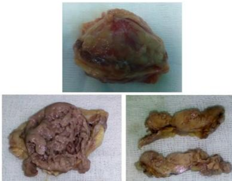
Figura 3: Imagen que muestra la anatomía macroscópica del tumor. Nótese las características externas al corte.

Tienen predominio en el lado derecho, sin conocerse la causa. En sentido general, el 90 % de estas neoplasias cromafines tienen una presentación esporádica, frente a solo un 10 % con presentación familiar. En este último caso se sabe que puede heredarse de forma aislada con herencia autosómica dominante o dentro de síndromes hereditarios, tales como: enfermedad