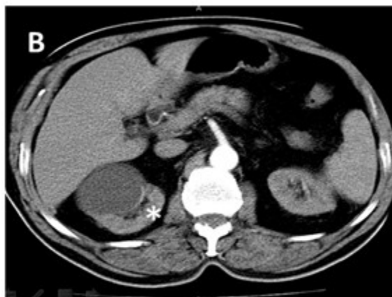
Figura 2: Imagen tomográfica que muestra el tumor (señalado por asterisco)

El paciente comenzó de forma súbita con disnea intensa que llegó a impedir el decúbito. Este cuadro se interpretó nosológicamente como un edema agudo del pulmón, del cual no logró estabilizarse y el paciente falleció.