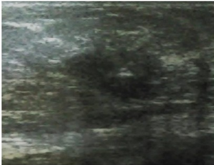
Figura 1. Ultrasonido donde se observa imagen hipocogénica de aspecto nodular, de contornos irregulares que mide 42 x 30 mm, con su centro a 22 mm de la piel.

Mamografía bilateral: mamas moderadamente grasas, heterogéneas, llamando la atención aumento de la densidad de la MI con respecto a su homóloga, observándose en el CSE próximo a la areola, imagen de aspecto nodular de 43 x 32 mm de contornos irregulares con presencia de microcalcificaciones. En la proyección axilar izquierda se observan varias adenopatías, la mayor mide 31 mm. Breast Imaging Reporting and Data System (BI-RADS) categoría 5: Altamente sugestivo de malignidad.