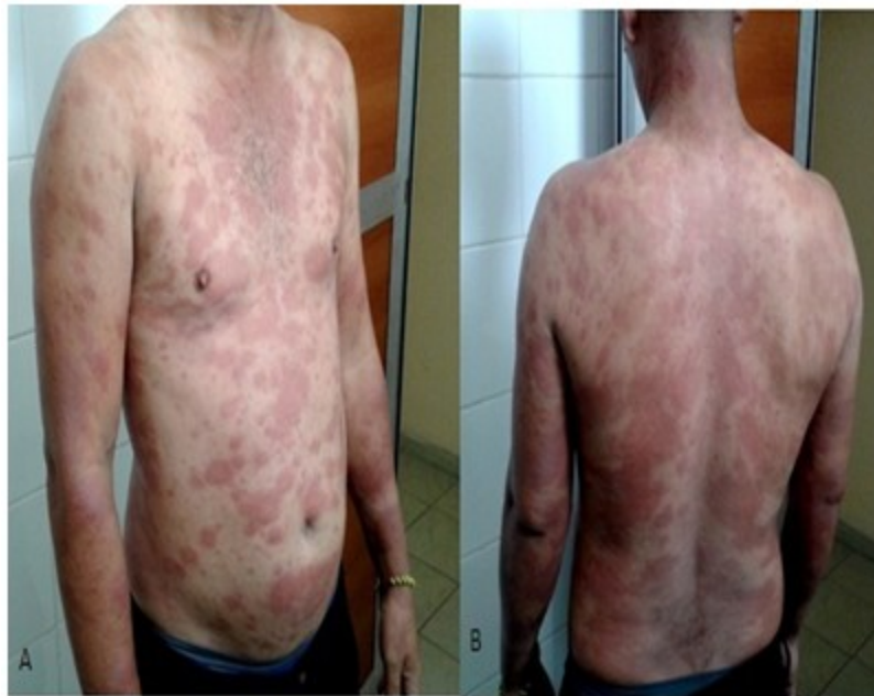
Fig.1. Lesiones maculares eritematosas, infiltradas, en tronco y extremidades superiores. A, región anterior. B, región posterior.

Examen físico-clínico-dermatoneurológico: Piel infiltrada, eritematosa, con presencia de múltiples lesiones maculares de color rojo violáceo de varios centímetros en tronco y extremidades (Fig.1. A y B), así como cara (frente, pómulos, y pabellones auriculares con nódulos pequeños), con alopecia parcial en cejas (Fig.2). Lesiones similares en región glútea. No presenta trastornos de la sensibilidad superficial ni profunda, fuerza muscular conservada y sin discapacidades. No se constatan nervios periféricos engrosados.