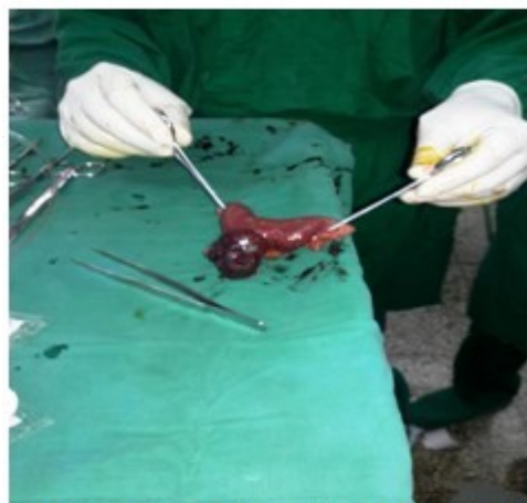
Figura 2. Muestra el tumor de intestino delgado y el área de sección.

Hallazgos: presencia de tumor de aproximadamente 5 x 4 cm., de forma pediculada en el borde anti mesentérico a una distancia de 1 metro del ángulo de TREITZ. (Figura 2).