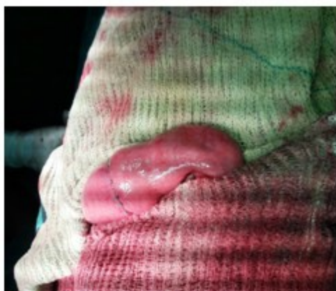
Figura 1. Muestra la anastomosis T-T en dos planos de sutura de intestino delgado.

Operación realizada: resección de un segmento de intestino delgado (yeyuno) y anastomosis termino-terminal (T-T) en dos planos de suturas. (Figura 1).