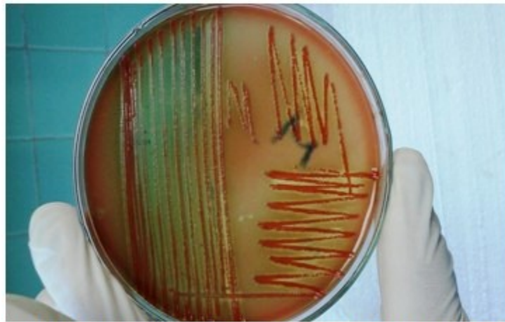
Figura 1. Crecimiento de la Serratia marcescens en Agar sangre de carnero al 5 % con pigmentación roja de las colonias (pigmento de prodigiosina).

Secreción de herida quirúrgica que se tomó con aplicador de algodón y se introdujo en medio de transporte Cary-Blair. Se sembró en medio universal, Agar sangre de carnero al 5 %, se sembró por estrías con asa bacteriológica. También se sembró en medio diferencial, Agar Mac Conkey, de igual forma. Se incubó a 37°C durante un periodo de 18 a 24 horas; después se realizó la lectura. Se obtuvo en Agar sangre de carnero al 5 % un cultivo puro de colonias que morfológicamente corresponden con un microorganismo Gram negativo. (Figura 1).