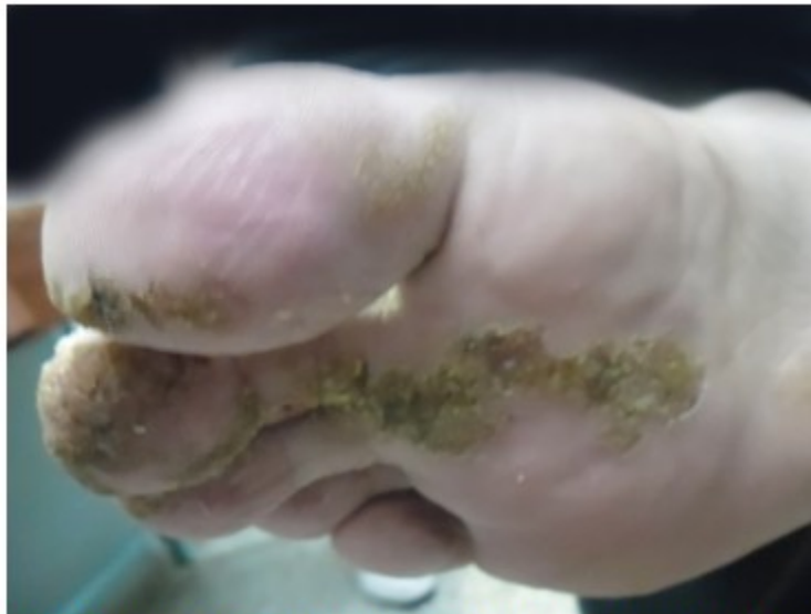
Figura 2. Lesiones hiperqueratósicas con distribución lineal que llegan a destruir la uña.