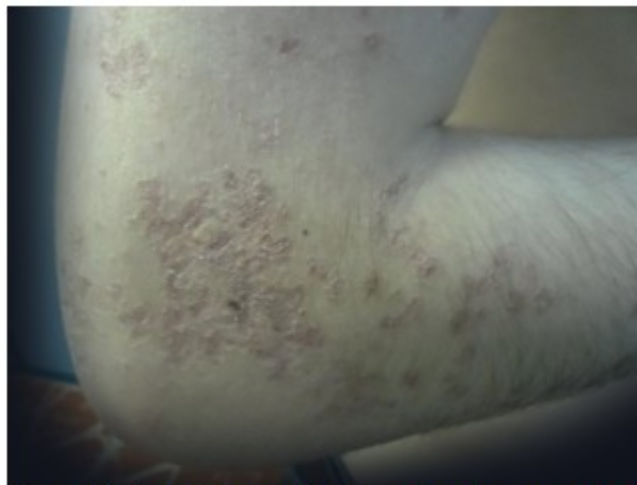
Figura 1. Lesiones hiperqueratósicas con bordes amurallados y centro atrófico.

genodermatosis, llevando varios tratamientos médicos, tales como: uso de cremas emolientes, queratolíticos, protectores solares, vitaminoterapia, cremas esteroideas, acitretin sistémico (el cual provocó reacciones secundarias que motivaron la supresión del medicamento) y seguimiento por psicología. A pesar de esto las lesiones en piel han empeorado, generalizándose por todo el tegumento cutáneo, predominando el patrón lineal, aumentando en número y tamaño, llegando a ser grandes placas con centro atrófico deprimido, lampiño, anhidrótico hipo o hiperpigmentado, rodeado por bordes queratósicos ligeramente elevados, que generan un resalto al tacto, extendidas hasta el lecho ungueal de algunos dedos de los miembros superiores e inferiores, siendo evidentes la destrucción de la matriz ungueal, la opacidad de la lámina ungueal y las estrías longitudinales. (Figura 1, figura 2 y figura 3). A pesar de las diferentes terapias tópicas y sistémicas, no se logró estabilidad ni curación de la enfermedad.