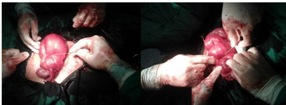
Figura 2. Tracción gentil de las suturas. Los extremos derecho e izquierdo se anudan en el fondo uterino de manera independiente.