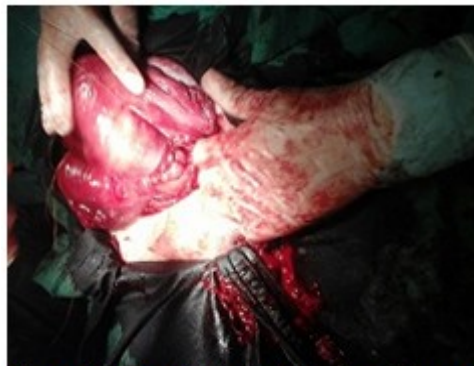
Figura 1. Se realizó transfijión desde la cara anterior a la posterior del segmento inferior uterino a 3 centímetros por debajo de la histerotomía y a 4 centímetros del borde lateral del útero.

satisfactoria. Se indicó profilaxis antimicrobiana de amplio espectro y de la enfermedad trombo embólica. La paciente fue egresada diez días después del parto, con una involución puerperal adecuada y sin otras complicaciones.