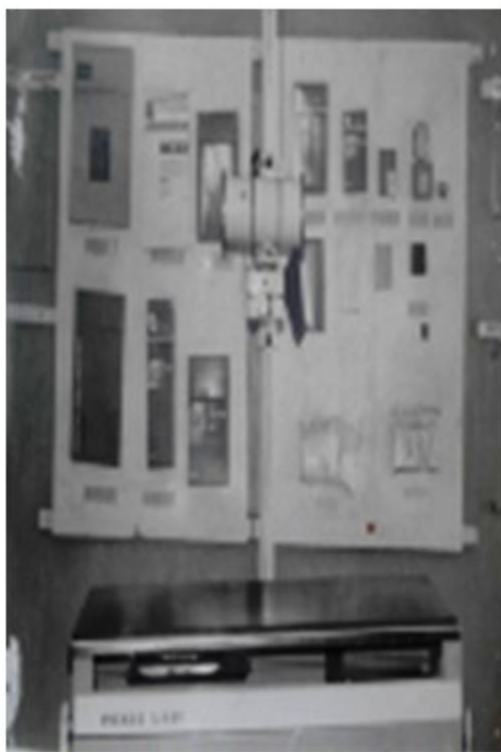
Figura 9. Equipo de rayos x convencional marca Picker.