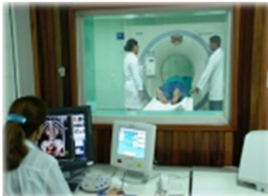
Figura 14. Equipo de Tomografía Axial Computarizada.

multicorte, resonancia magnética por imágenes (RMI), densitómetro, mamografía, intensificador de imágenes, ultrasonidos y equipos convencionales para estudios simples y contrastados. (Figura 14, 15 y 16).