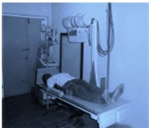
Figura 11. Equipo de rayos X convencional de Urología y equipo portátil (1979).