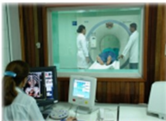
Figura 14. Equipo de Tomografía Axial Computarizada.

multicorte, resonancia magnética por imágenes (RMI), densitómetro, mamografía, intensificador de imágenes, ultrasonidos y equipos convencionales para estudios simples y contrastados. (Figura 14, 15 y 16).