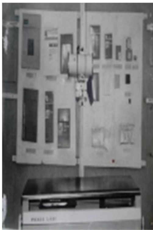
Figura 9. Equipo de rayos x convencional marca Picker.