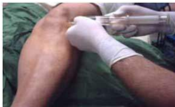
Figura 2. Inyección de bupivacaína en el portal superior externo.

%, en un volumen de 20 ml, distribuidos en 4 portales a razón de 5 ml en cada uno. (Figuras 2 y 3)