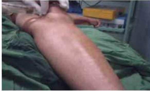
Figura 3. Inyección de bupivacaína en el portal superior interno.

En la piel y el tejido celular subcutáneo, a nivel del portal donde se introdujo el artroscopio se aplicó bupivacaína 5 ml al 0,25 % Se esperaron