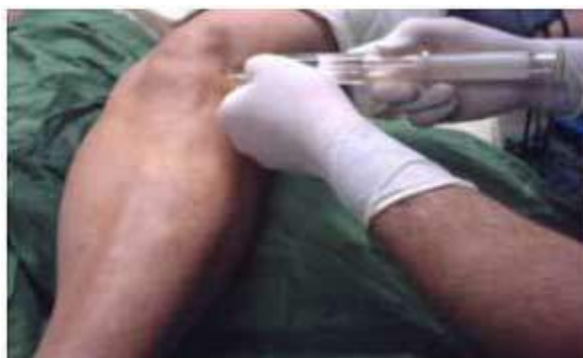
Figura 2. Inyección de bupivacaína en el portal superior externo.

%, en un volumen de 20 ml, distribuidos en 4 portales a razón de 5 ml en cada uno. (Figuras 2 y 3)