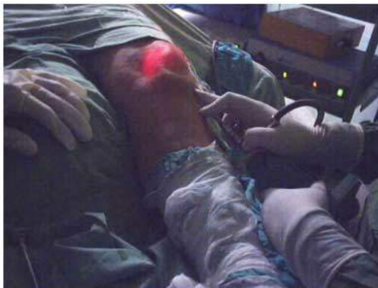
Figura 4. Punto de introducción del artroscopio.

15 minutos para comenzar el proceder, previa prueba de analgesia de la zona. Se introdujo artroscopio preferentemente en el portal inferior externo. (Figura 4)