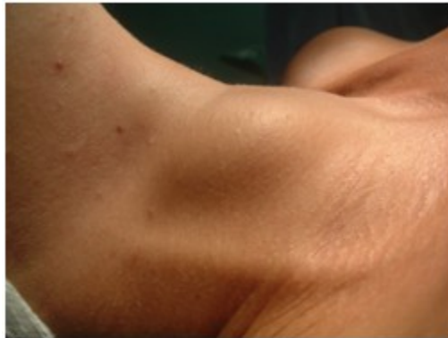
Figura 4. Vista lateral del cuello, donde se observa el aumento de volumen.

4), y que se prolongaba hacia la parte superior del tórax, no adherida a planos profundos y sin acompañarse de adenopatías.