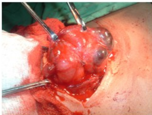
Figura 5. Exsérésis del tumor.

Como en el primer caso, el tratamiento quirúrgico aplicado fue la hemitiroidectomía derecha, con istmectomía y resección de la prolongación mediastínica del tumor (Figura 5, figura 6). No se presentaron complicaciones y la evolución fue satisfactoria.