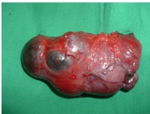
Figura 6. Pieza quirúrgica.