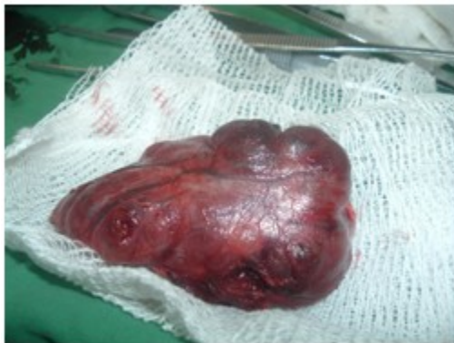
Figura 3. Pieza quirúrgica.