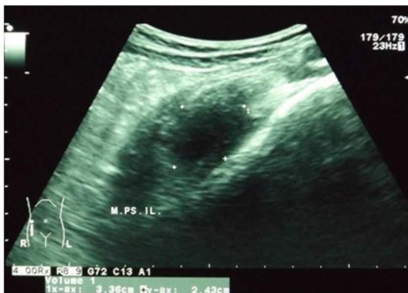
Figura 3. Ecografía pélvica de seguimiento con imagen ovoidea de bordes definidos, heterogénea de predominio hipocogénico compatible con hematoma antiguo con disminución del volumen sin datos de infección.