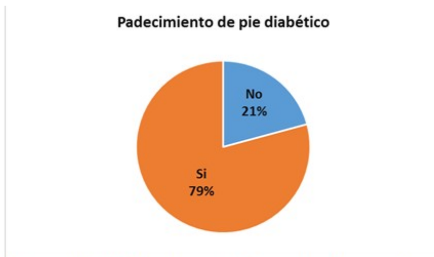
Figura 2. Distribución de los pacientes según padecimiento de pie diabético

Al realizar análisis bivariado para determinar los factores de riesgo más significativos en el padecimiento del pie diabético, se obtuvieron los siguientes: edad, tiempo, hábito de fumar,