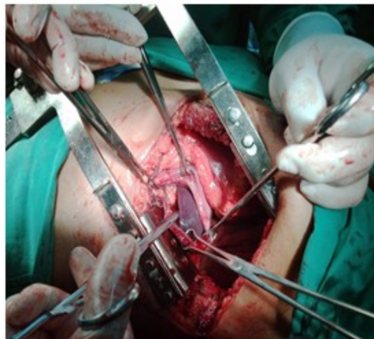
Figura 2: Bordes del diafragma lesionado, tomado con pinzas de Backcock, para introducir los órganos a la cavidad abdominal y comenzar la frenorrafia.

Se realizó una frenorrafia. (Figuras 2 y 3).