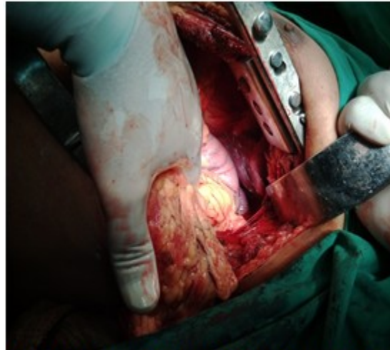
Figura 1: Apertura de la cavidad torácica izquierda, donde se observa epiplón, estómago y pulmón colapsado.

donde se observa epiplón, estómago y pulmón colapsado.