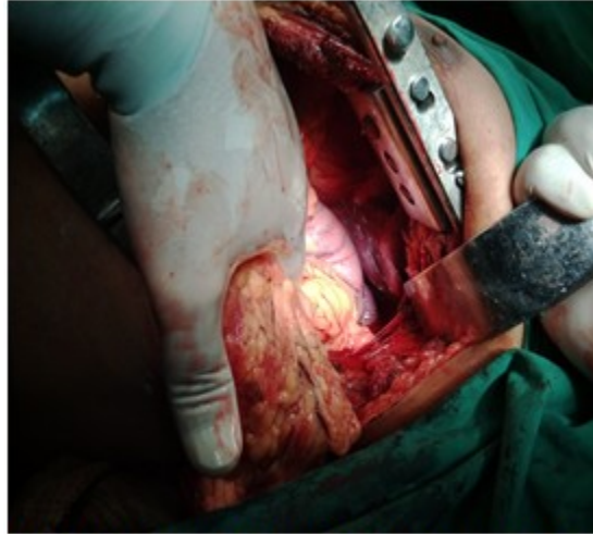
Figura 1: Apertura de la cavidad torácica izquierda, donde se observa epiplón, estómago y pulmón colapsado.

donde se observa epiplón, estómago y pulmón colapsado.