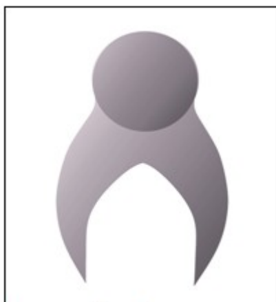
Figura 2. Formas que representan a los ancianos.

Las figuras se encuentran ubicadas en la posición de los cuatro puntos cardinales, formando una especie de ronda en la que los sujetos, enfocados desde una vista superior, elevan las manos sosteniendo el acrónimo identitario (APE) para representar la necesidad de colaboración, solidaridad y esperanza, así como la universalidad del mensaje a transmitir. El acrónimo emerge de una flor blanca (símbolo de la pureza y las causas positivas) formada por la unión de las manos de las figuras. (Figura 3).