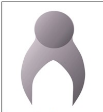
Figura 2. Formas que representan a los ancianos.

Las figuras se encuentran ubicadas en la posición de los cuatro puntos cardinales, formando una especie de ronda en la que los sujetos, enfocados desde una vista superior, elevan las manos sosteniendo el acrónimo identitario (APE) para representar la necesidad de colaboración, solidaridad y esperanza, así como la universalidad del mensaje a transmitir. El acrónimo emerge de una flor blanca (símbolo de la pureza y las causas positivas) formada por la unión de las manos de las figuras. (Figura 3).