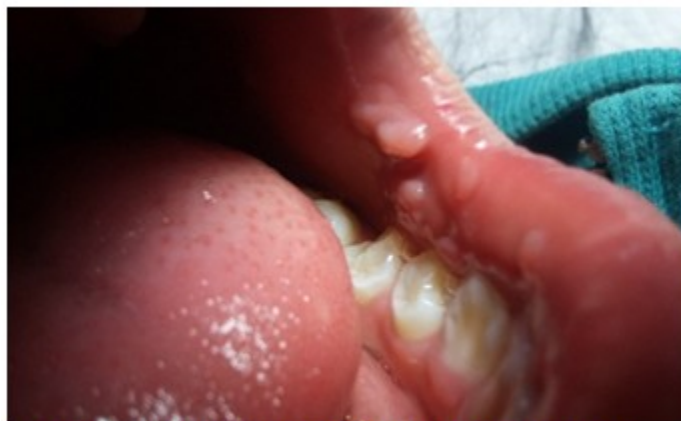
Figura 1. Lesiones papulomatosas a nivel de mucosa oral de los carrillos.

Al examen dermatológico de la cavidad bucal, se encontraron múltiples pápulas ovaladas, con tendencia a agruparse, diseminadas en toda la cavidad bucal y en la lengua, del color de la mucosa oral, de consistencia blanda, de superficie lisa y brillante, de 0,3 mm a 1 cm, no dolorosas. (Figura 1, figura 2 y figura 3).