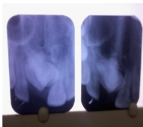
Figura 1. Vista radiográfica donde se observa el odontoma que causa la retención del incisivo central superior (11).

Se indicó seguimiento radiográfico, el cual se mantuvo por tres meses para ver si existía regeneración ósea. Durante este tiempo, se le colocó un mantenedor de espacio estético. A los ocho meses de evolución, se intervino quirúrgicamente para colocar un botón de cementado directo en la cara vestibular del incisivo central superior (pieza 11) y se procedió a su entorchado. Se observó clínica y radiográficamente la presencia de hueso de neoformación; se suturó y se aplicó aparatología fija para luego colocar y alinear el diente en el arco dentario (Figura 5). Se interconsultó con parodoncia para la realización de una gingivoplastia en una segunda etapa. (Figura 6).