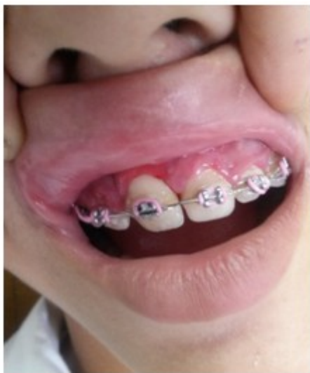
Figura 6. Vista del incisivo central superior derecho (11) en su posición correcta en el arco dentario.