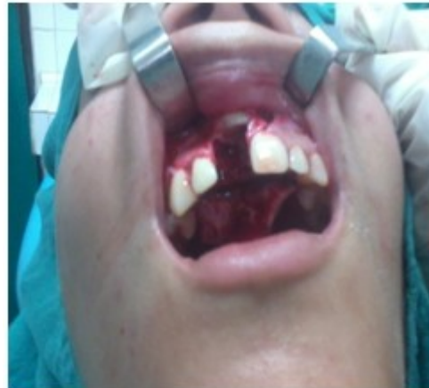
Figura 4. Se observa el defecto óseo posterior a la cirugía.