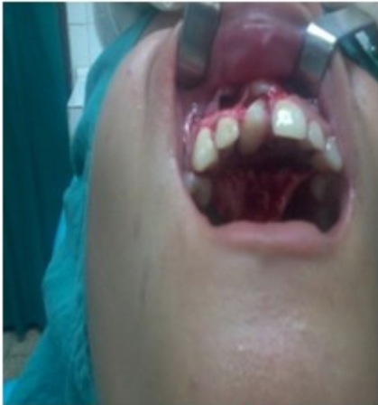
Figura 2. Vista del odontoma complejo en boca.