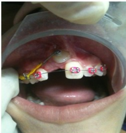
Figura 5. Tracción del incisivo central superior (11) a su lugar en el arco dentario.