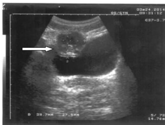
Figura 2. Imagen anterior donde se observa desplazamiento de la vejiga hacia abajo.