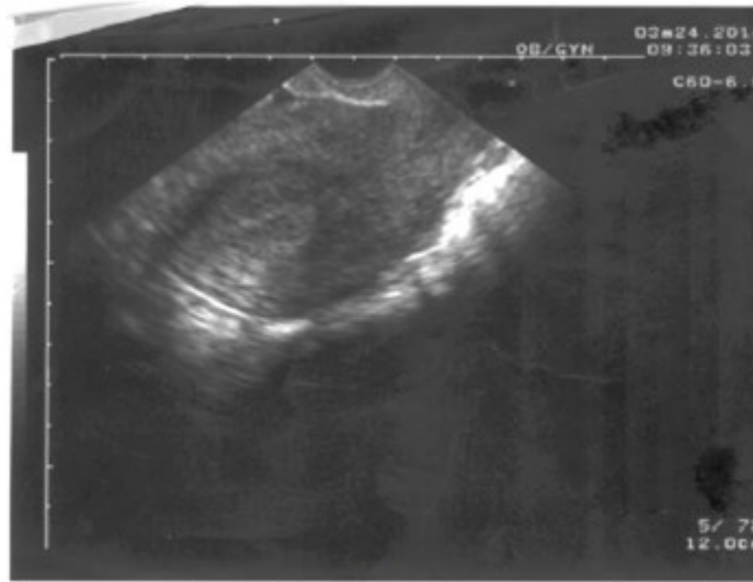
Figura 3. Útero de tamaño normal sin dispositivo intrauterino.

dispositivo intrauterino y sin alteraciones anexiales. (Figura 3).