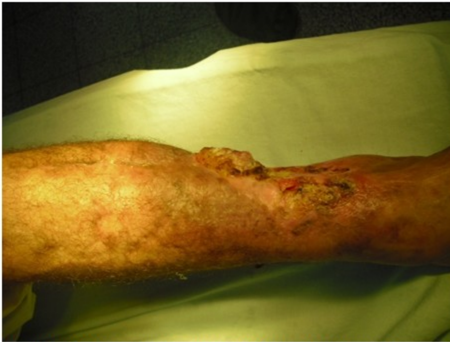
Figura 1. Vista lateral que muestra la úlcera sobre la cicatriz vegetante y de rápido crecimiento.