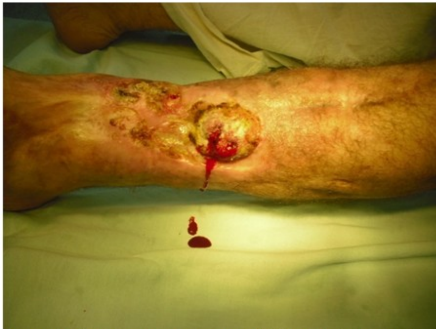
Figura 2. Vista frontal que muestra la friabilidad de la úlcera así como el sangrado fácil.