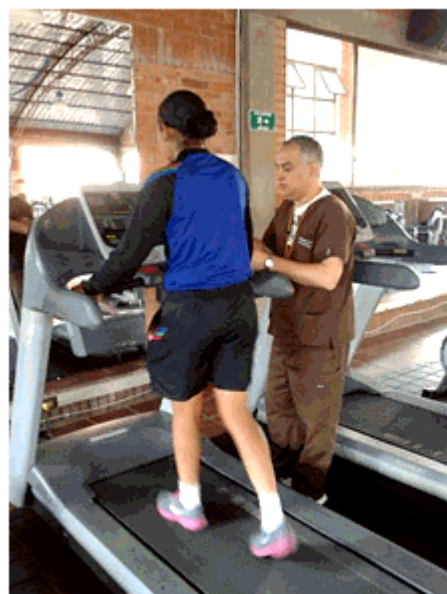
Figura 3. Imagen que muestra a la paciente durante la prueba.

Antes de iniciar la prueba se le mostró nuevamente la escala analógica visual (EVA) y se les explicó a la cadete que cuando aparecieran síntomas de dolor que fuesen a ser molestos se asociaría con una puntuación de 4 en la escala y se detendría la prueba. En la evaluación inicial la paciente solo consiguió trotar dos minutos y 15 segundos antes de detener la prueba de trote. (Figura 3).