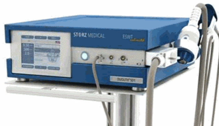
Figura 5. Equipo Duolith SD1 T-Top marca Storz Medical.

Para el tratamiento con las ondas de choque se siguió los parámetros que se detalla en la