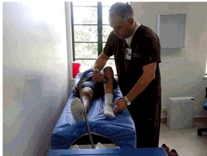
Figura 4. Imagen que muestra a la paciente durante el tratamiento con ondas de choque extracorpóreas focalizadas.

utilizando un equipo de generación de ondas de choque extracorpóreas Duolith SD1 T-Top marca Storz Medical. (Figura 5).