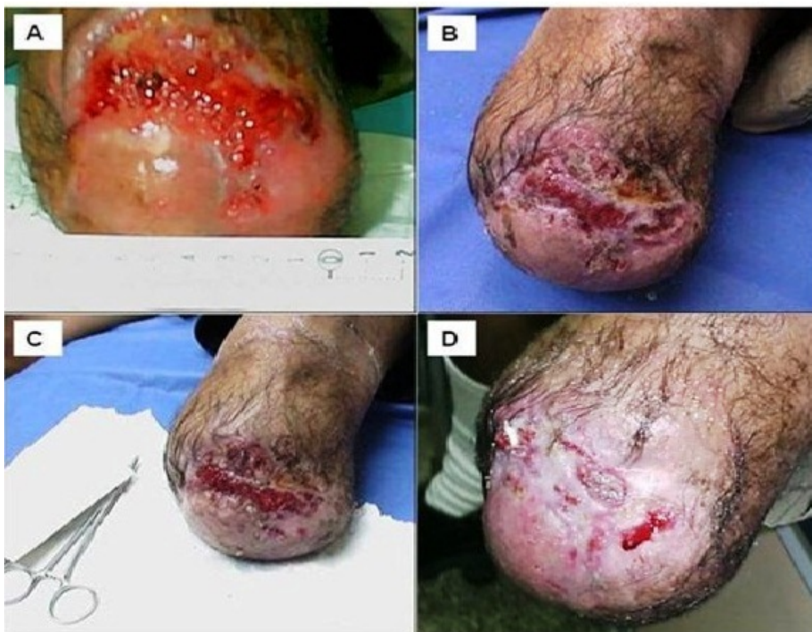
Foto 2. Úlcera vascular : sin tratamiento (A), después de 1 semana de tratamiento con el equivalente epidérmico (B), al cabo de la segunda semana de tratamiento con el equivalente epidérmico (C), a la tercera y cuarta semana de tratamiento con el equivalente epidérmico (D).

La evolución del resto de los pacientes fue la esperada con este tipo de procedimiento, respondieron todos al tratamiento con los implantes. Dos de los pacientes tratados, como consecuencia de que el tamaño de la úlcera era muy grande, mayor de 50 cm 2 , además de la condición de ser úlceras con lesiones crónicas de larga data, presentaban lechos muy atróficos para que el tratamiento con los equivalentes funcionaran bien, por lo que fue necesario una limpieza inicial de la herida para retirar el tejido fibroso y necrótico, y de esta manera crear un ambiente óptimo para recibir el trasplante. Esto hace que las células del equivalente puedan actuar induciendo la regeneración de las células del borde de la úlcera de la piel del paciente.