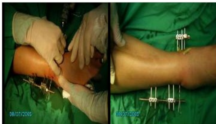
Figuras 3 y 4. Imágenes finales del procedimiento quirúrgico.

Una vez realizados estos procedimientos queda colocado el minifijador. (Figuras 3, 4)