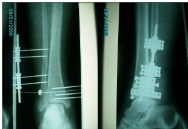
Figuras 5 y 6. -Imágenes radiográficas anteroposterior y lateral que muestran la fijación realizada.

se realizaron rayos X que mostraron cómo quedó colocado el minifijador. (Figuras 5 y 6)