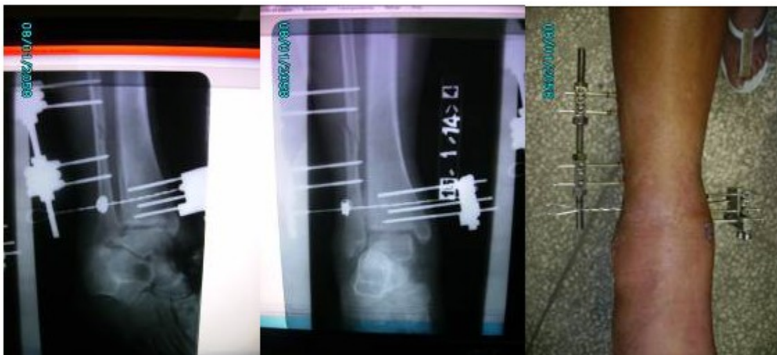
Figuras 7, 8, y 9 -Imágenes que muestran la fijación, a los 30 días de la operación.

A los treinta días de la cirugía, se realizaron radiografías oblicua y anteroposterior del tobillo afectado y se tomó una foto que mostró aspecto del mismo con el fijador colocado. (Figuras 7, 8 y 9).