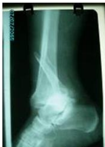
Figura 2. Imagen radiográfica lateral que muestra la fractura luxación del tobillo.

La paciente sufrió una grave fractura- luxación del tobillo derecho con fractura suprasindesmal del peroné, lesión sindesmal, lesión del ligamento deltoideo y fractura del reborde antero externo del pilón tibial.