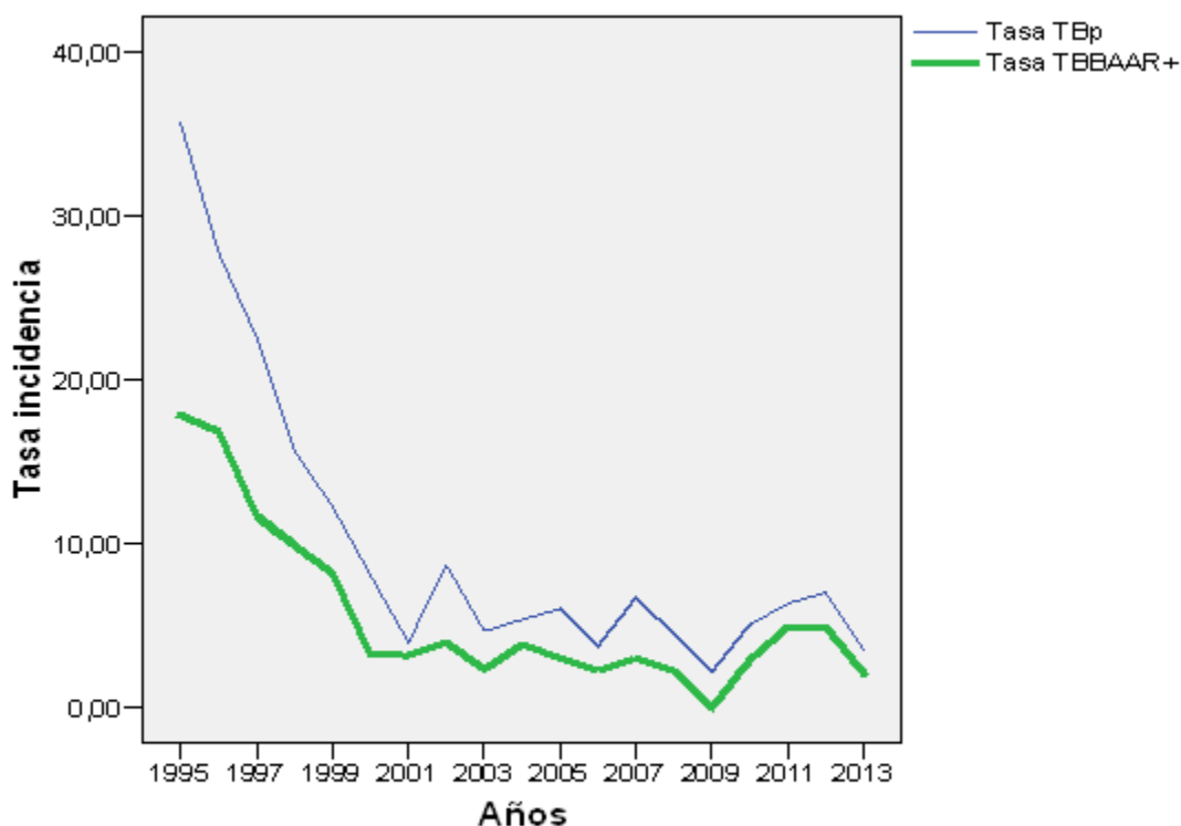
Figura 1. Tasa de incidencia de tuberculosis (TBp y TB BAAR+) según población estimada mayor de 15 años

Entre los años 1995 y 2000 existió una disminución abrupta de las tasas de incidencia de los enfermos TB BAAR+. A partir del 2001 se presentó un comportamiento relativamente estable, con discretas oscilaciones; pero con tendencia decreciente de los casos nuevos notificados hasta el 2010, el año 2009 fue la excepción, porque no se diagnosticaron casos por dificultades presentadas en el Departamento de Microbiología del Centro Provincial de Higiene y Epidemiología, razón por lo que no fue considerado en el análisis de la serie al ser considerado no válido para el modelo exponencial. Entre los años 2010 y 2012, se observó un incremento ligero del número de enfermos y nuevamente ocurrió un descenso en el año 2013. Los pacientes TB BAAR+ representaron el 56,1 % del total de notificados como TBp en el estudio. (Figura 1; Tabla 1).