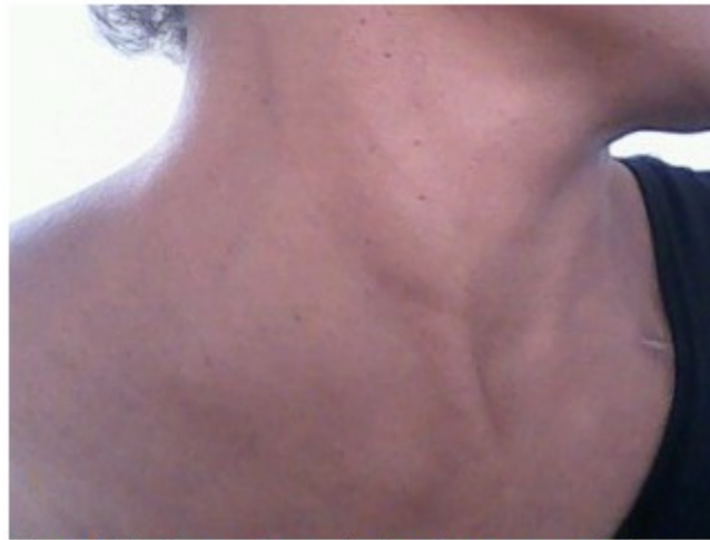
Figura 1. Se observa el aumento de volumen en ganglios de cadena cervical lateral derecha.