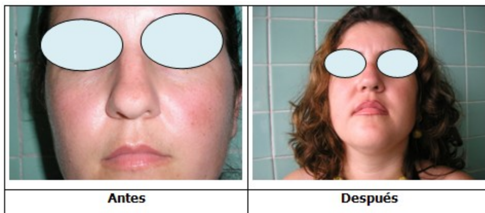
Figura 1. Rinoplastia primaria de la punta, técnica endonasal. Se realizó resección parcial de los cartílagos alares.

Fueron operados 185 mujeres y 60 hombres. En 56 pacientes la cirugía estuvo encaminada a estrechar la punta nasal (Figura 1); en 45 pacientes a la rotación de la punta nasal (Figura 2); y en 44 pacientes a la proyección de la punta nasal. (Figura 3).