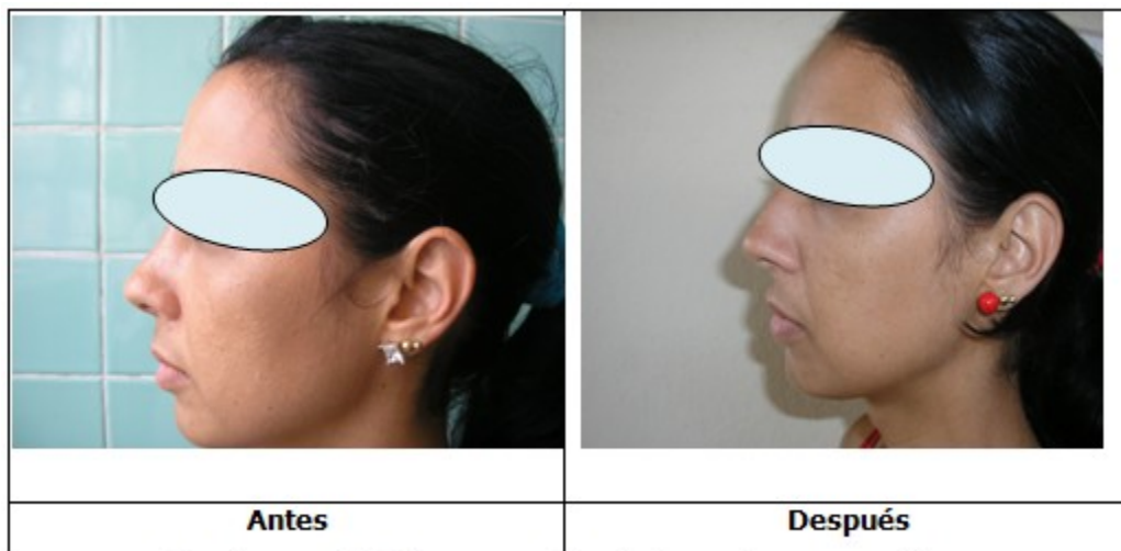
Figura 2. Reducción y rotación de la punta nasal por la técnica de sutura interdómica.