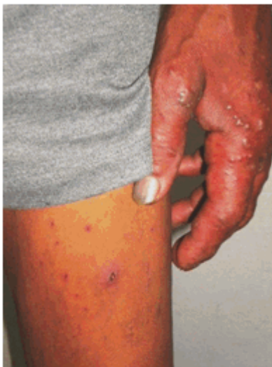
Figura 3. Lesiones eritematosas y vesiculosas en mano izquierda, y eritemato-costrosas en muslo de ese lado. Presencia de algunas pústulas en dorso de mano.

Específicamente en la cavidad oral, se encontraron lesiones candidiásicas, pseudomembranosas y blanquecinas en lengua, carrillos y comisuras labiales, además de varias caries dentales (Figura 4).