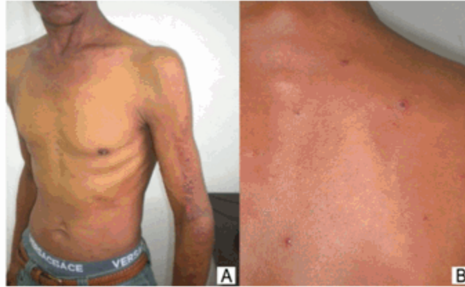
Figura 2. Lesiones eritemato-vesiculosas y costrosas, con algunas áreas erosivas en brazo y antebrazo (A). Lesiones en espalda superior eritemato-vesículo-costrosas (B).